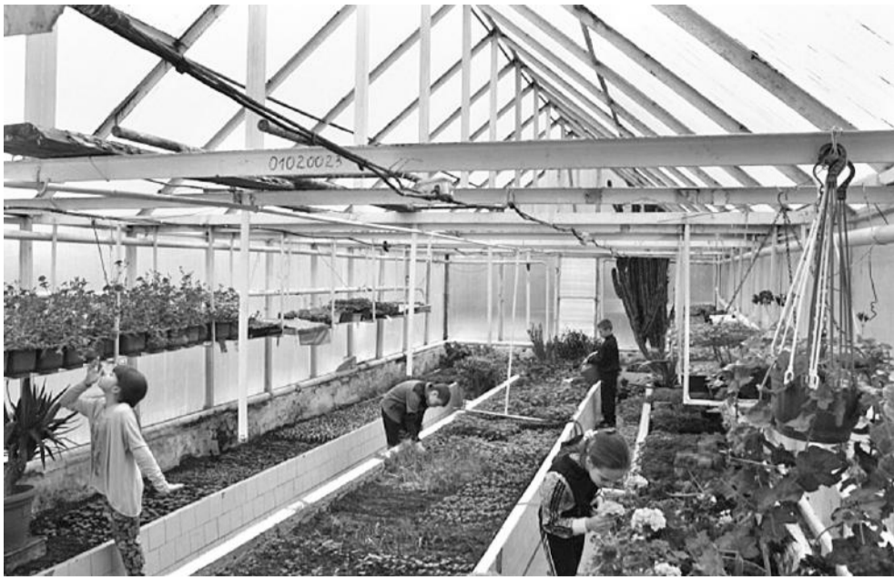
Школа имеет учебно-опытный участок площадью 0,75 га, где выращивают овощи и фрукты. В теплице зимой — зелень, весной — саженцы цветов

класса с современным оборудованием, шесть логопедических кабинетов, комната психологической поддержки, вокальная студия, спортивные и игровые площадки.