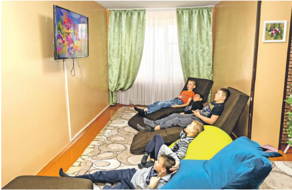
В свободное время можно посмотреть телевизор