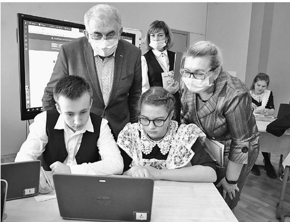
Решать олимпиадные задачи на платформе «Учи.ру» интересно и полезно!