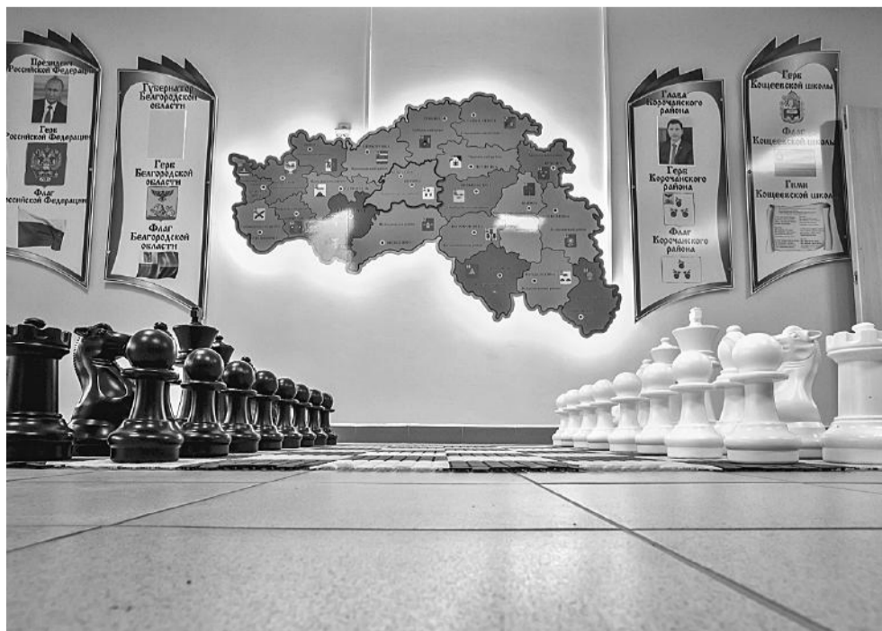
Оформление стен в Коцевова школе Корочанского района