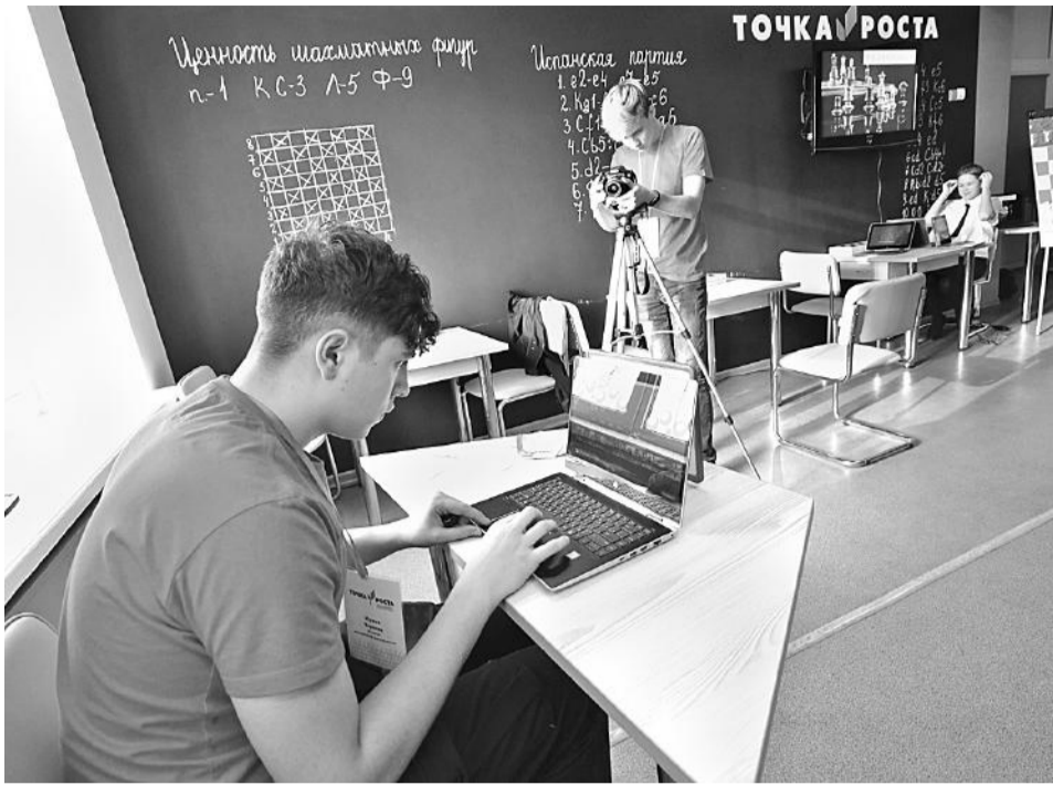
Школьная киностудия «Новое поколение»