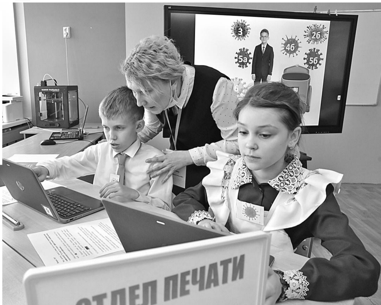
Отделу печати поставлена задача: найти информацию по профилактике коронавируса