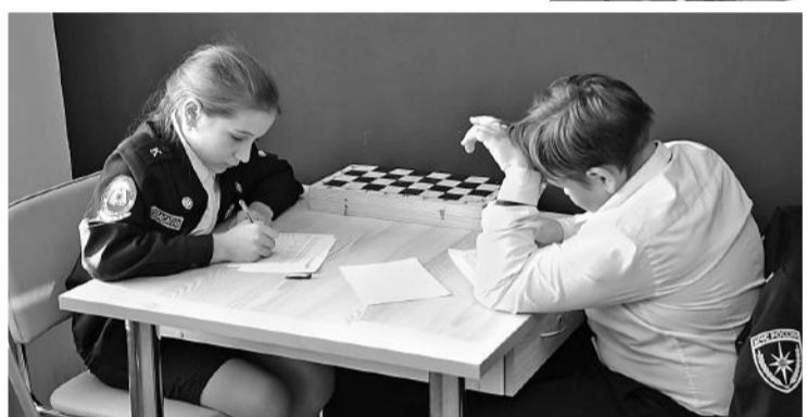
Рассчитать ценность шахматных фигур — задача нелёгкая