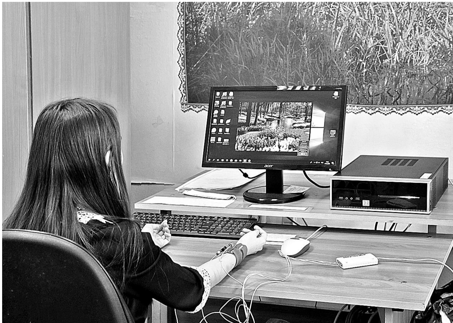
На занятии в кабинете БОС-здоровье

КАК КОРОЧАНСКАЯ ШКОЛА-ИНТЕРНАТ ДАЁТ ПУТЁВКУ В ЖИЗНЬ ДЕТЯМ С НАРУШЕНИЯМИ РЕЧИ