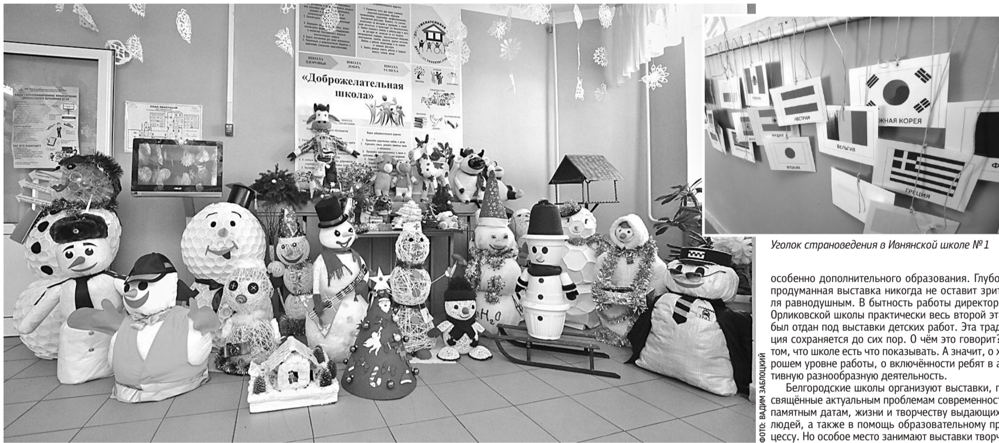
Оформление стен и рекреаций Гостищевской школы Яковлевского округа создаёт новогоднее настроение