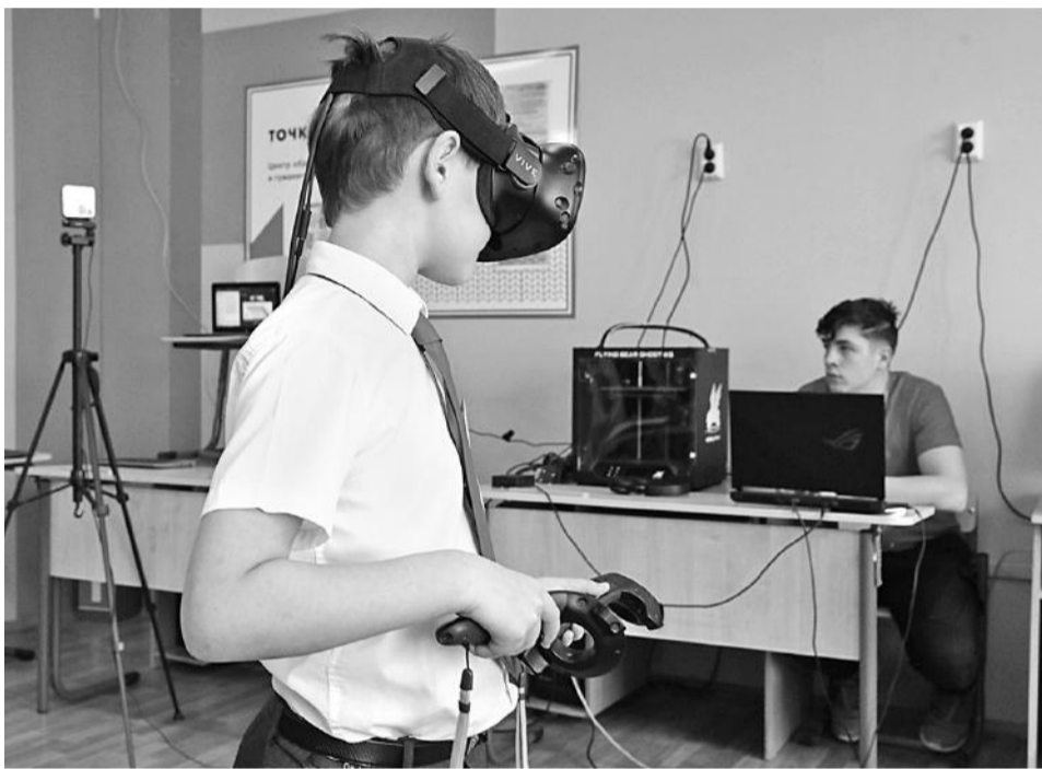
Путешествие вглубь лёгких с помощью очков виртуальной реальности

Старшеклассники Гостищевской школы раз в неделю на математике занимаются на платформе «Учи.ру». На внеурочке этот ресурс тоже активно используется. Нам показали одно из таких занятий: школьники выполняли на ноутбуках задания пробного тура олимпиады Vicsmatch.com+.