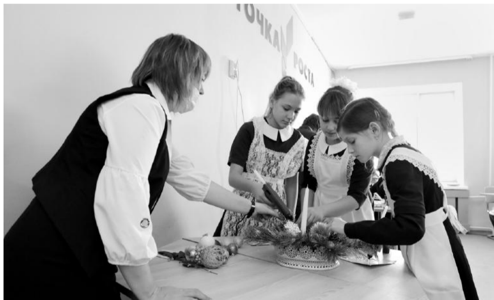
Девчонки из кружка «Станем волшебниками» за несколько минут создали новогоднюю композицию