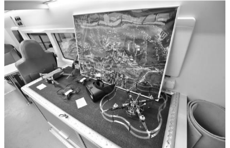
Мобильный «Кванториум» «начинён» современным оборудованием

Передвижная лаборатория с высокотехнологичным оборудованием с сентября колесит по шести муниципалитетам региона: Яковлевскому и Шебекинскому округам, Белгородскому, Борисовскому, Корочанскому и Прохоровскому районам.