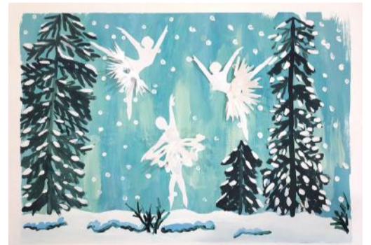
Коллективная работа объединения «Бумажные фантазии»