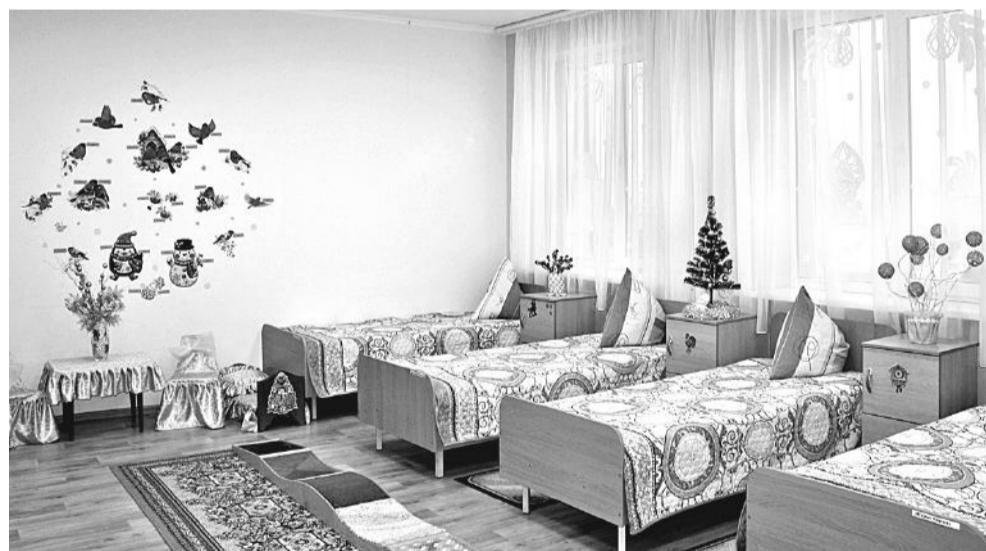
Спальная комната учеников начальных классов

классов ещё учатся в межшкольном учебном центре на водителей категории В.