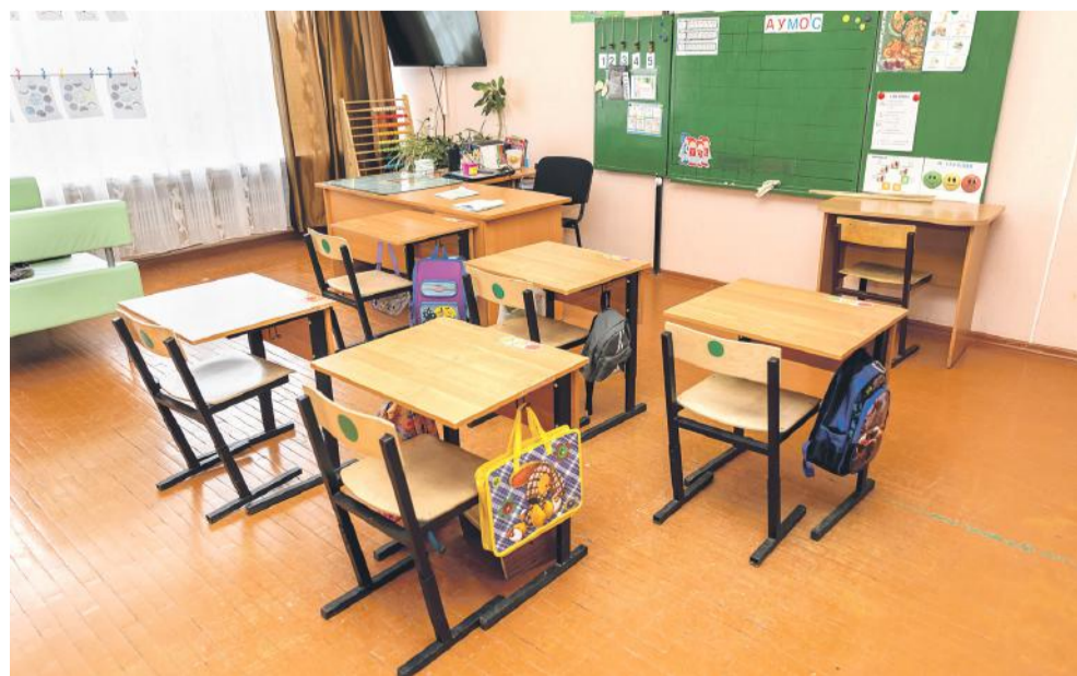
Класс для учеников с тяжёлыми интеллектуальными отклонениями

Слово «социализация» — слишком серьёзное, безликое, официальное. Но означает оно очень многое. Фактически — всю жизнь ребят в школе-интернате. Многие «особенные» дети совсем по-другому