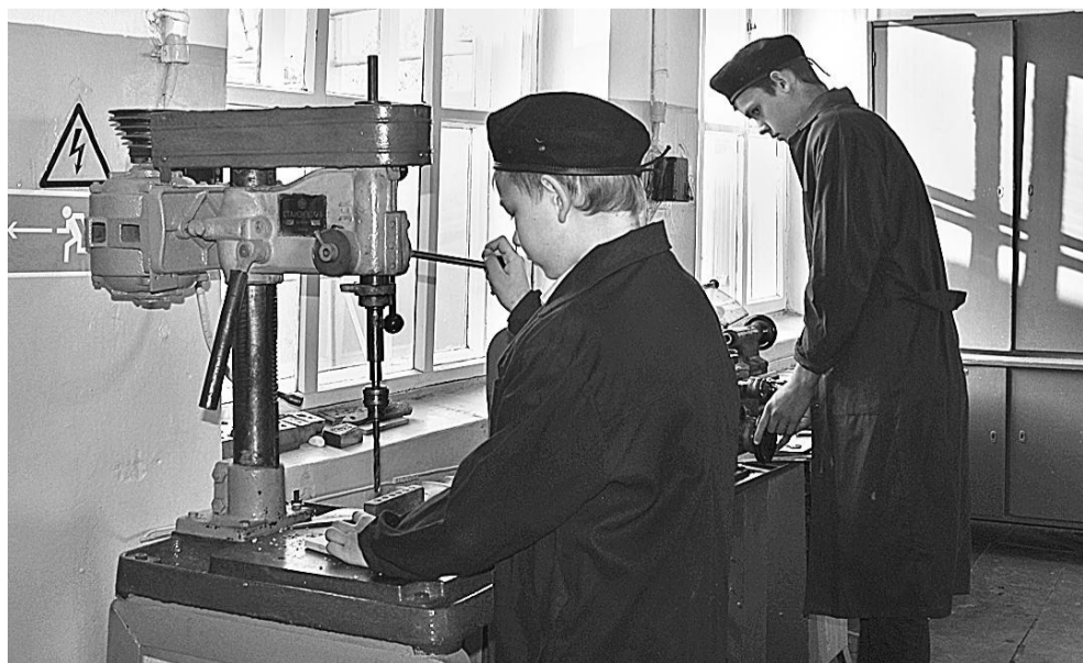
В школьной мастерской мальчишки учатся столярному и слесарному делу