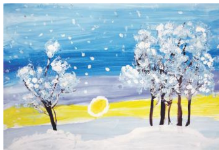
«Снег». Рисунок Юрия Кривокустава (руководитель Дина Кислиця)