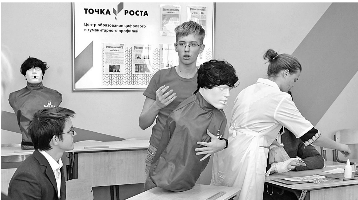
Оказывать первую помощь пострадавшим школьники учатся на манекенах-тренажёрах