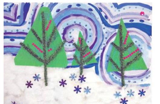
Коллективная работа объединения «Бумажные фантазии»