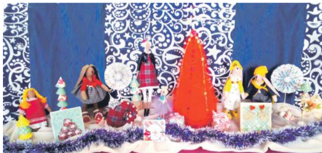
Подделки ребят из объединения «Умелые ручки»