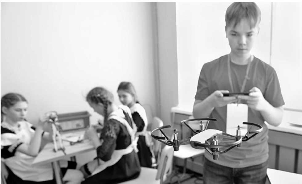
Запуск квадрокоптеров — любимое занятие мальчишек