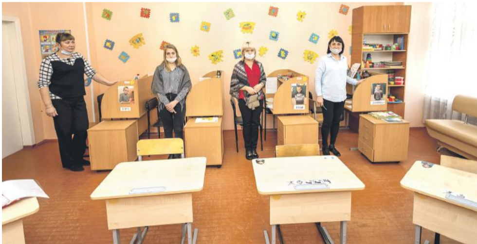
Тьюторы: каждый занимается с одним ребёнком с самыми тяжёлыми проблемами со здоровьем