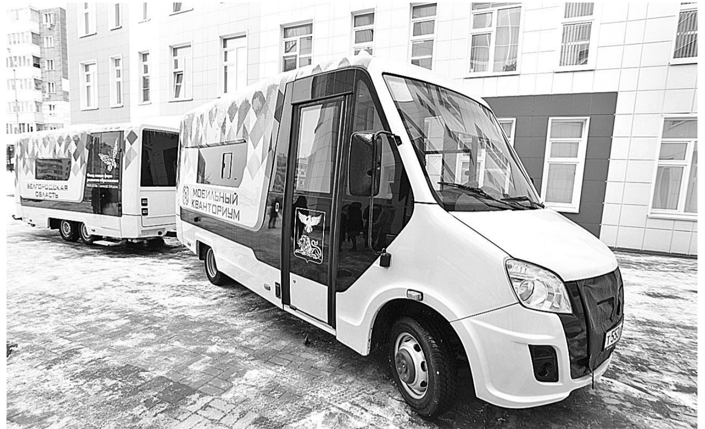
Мобильный технопарк «Кванториум»

КАК МОБИЛЬНЫЙ «КВАНТОРИУМ» ПОМОГ ОХВАТИТЬ ДОПОБРАЗОВАНИЕМ ТЕХНИЧЕСКОЙ НАПРАВЛЕННОСТИ УЧЕНИКОВ СЕЛЬСКИХ ШКОЛ