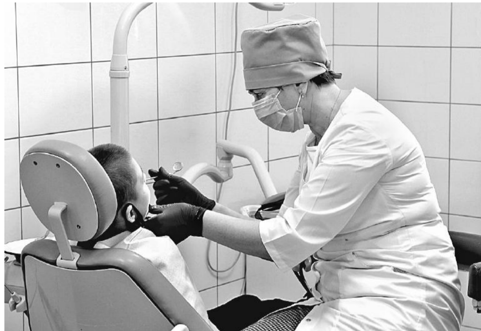
В лечебно-оздоровительном комплексе Корочанской школы-интерната оборудован стоматологический кабинет

Все дети в Корочанской школе-интернате с сохранным интеллектом, так что проблем с их социализацией нет. Но чтобы лучше подготовиться к взрослой жизни, участвуют в проекте «Уроки финансовой грамотности», а в рамках школьной программы на уроках технологии девочки учатся швейному делу (могут они и приготовить несложные блюда: салаты, оладьи, блины...), мальчишки в мастерских — столлярному и слесарному. Ученики 10–11-х