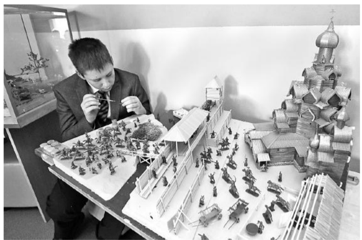
Вот такой макет старинной крепости ребята сделали своими руками