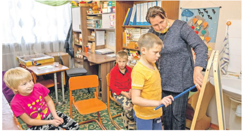
Творческие занятия на внеурочке