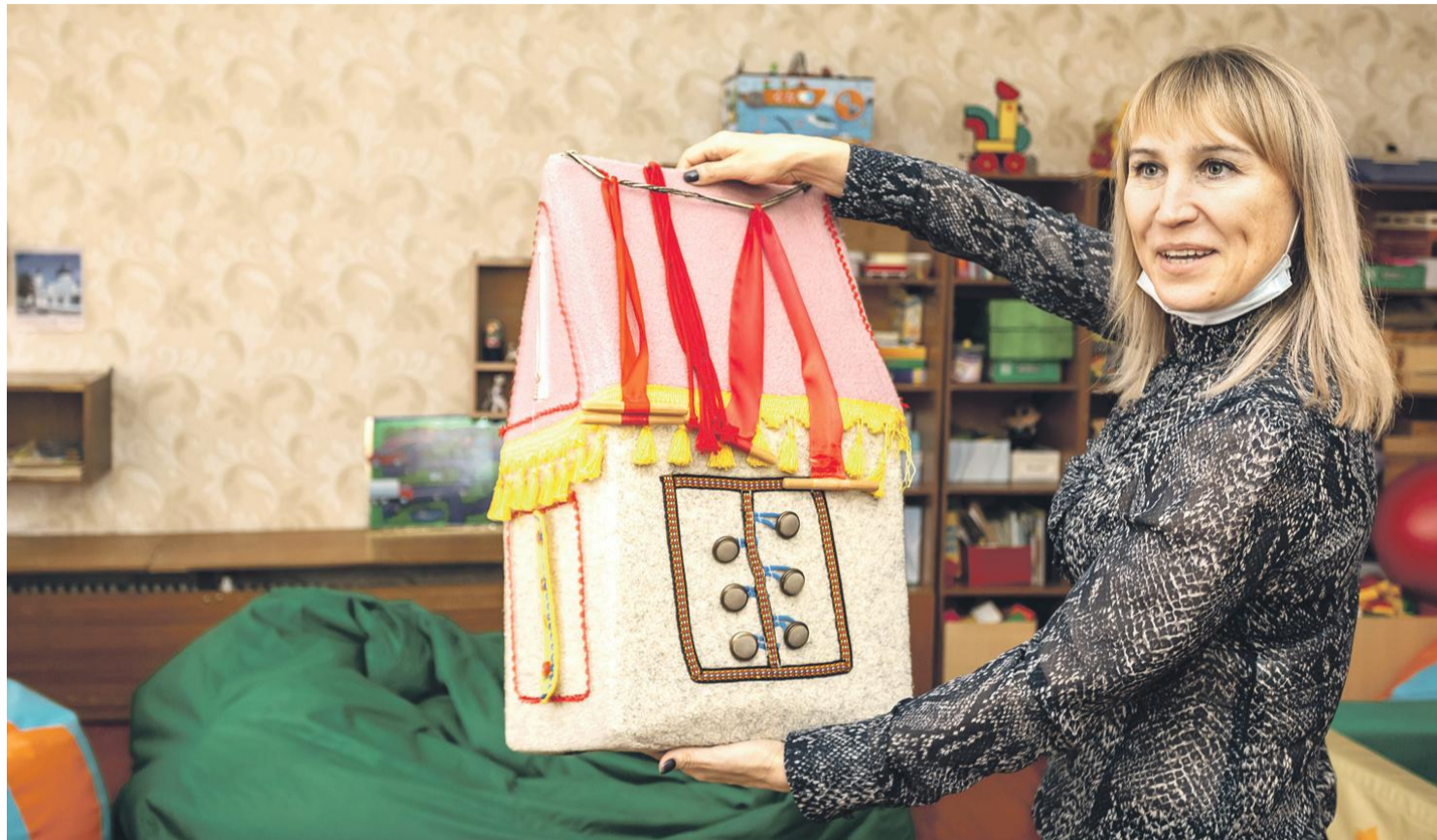
Оборудование для развития мелкой моторики

ПОЧЕМУ В НОВООСКОЛЬСКОЙ ШКОЛЕ-ИНТЕРНАТЕ РЕБЯТАМ ХОРОШО ТАК ЖЕ, КАК ДОМА