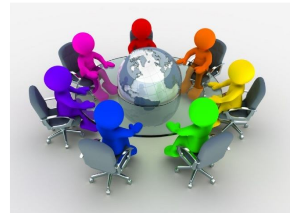
Организация практического семинара для специалистов образовательных учреждений района