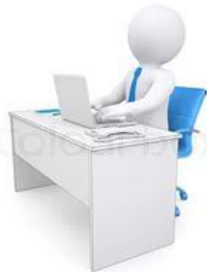
Разработка методических рекомендаций