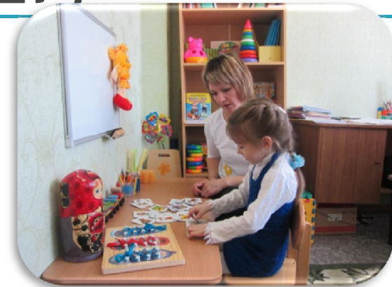
Кабинет учителя - логопеда

муниципальный пункт по психолого-педагогическому сопровождению родителей (законных представителей) детей с ограниченными возможностями здоровья и детей – инвалидов на базе МБДОУ ДС № 8