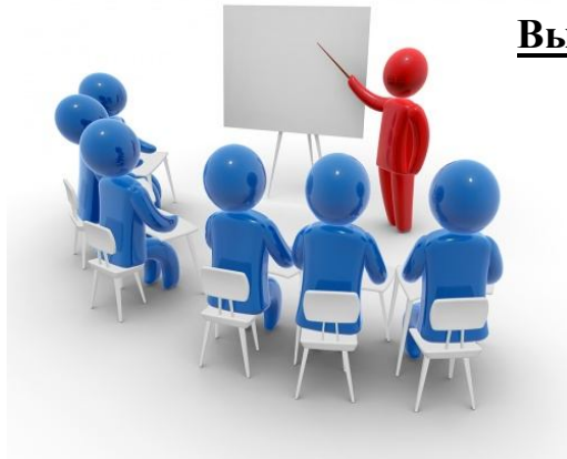
Повышение квалификации специалистов