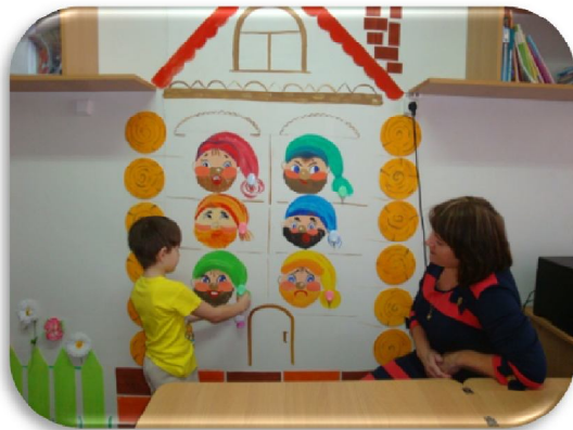
Кабинет педагога - психолога