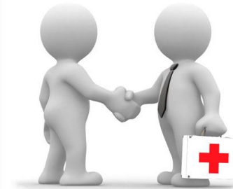
Психолого-педагогическое сопровождение родителей